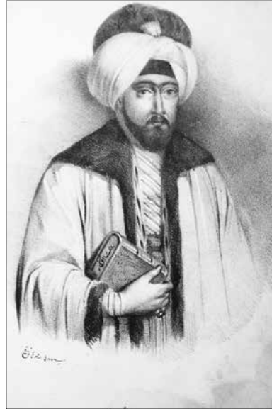
Keçecizade İzzet Molla

Sürgündeyken sadrazam Galip Mehmet Paşa'ya sunduğu kaside çok beğenilince 24 Şubat 1824'te affedildi. 1825'te Mekke, 1826'da İs-