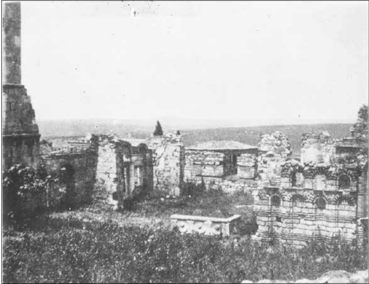
Apokaukos Kilisesi (sonradan Fatih Camisi) (1912/13'te Bulgarlar tarafından çekilmiş fotoğraf)