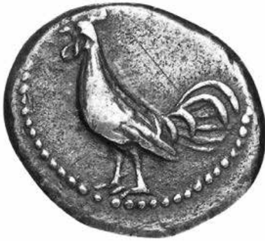
Silivri'nin ünlü “horozlu para”sının (MÖ 420-410) güzel bir örneği, Berlin Devlet Müzeleri Nüvizmatik Bölümü'nde.

Her iki evrede de Silivri, az sayıda seriler halinde küçük gümüş sikkeler bastı. Bu paraların ön yüzünde “duran horoz”, arka yüzde önceleri “oyma dörtgen” (quadratum incusum) ve ikinci basım evresindeyse “buğday başağı” yer almaktaydı. Arka yüzde görülen SA ( \Sigma A ) ve Lİ ( \Lambda Y ) kısaltması kentin adını simgeler: Salymbria/Selymbria.