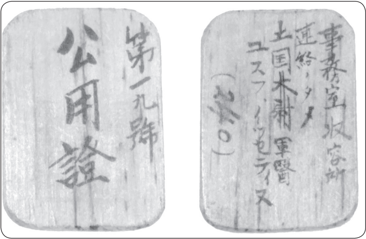
Görsel 12. Vladivostok esir kampında bulunan (1920 - 1921) kıdemli esirler şehre gidebilmek için üzerinde Japonca yazılar ve mühür bulunan tahtadan yapılmış bu belgeyi kapıdaki nöbetçiye göstererek kamptan serbestçe çıkabiliyorlardı.