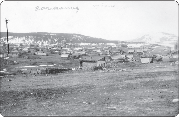
Görsel 14. Esir olarak Sankamış'a ilk geldikleri gün kaldıkları ev.