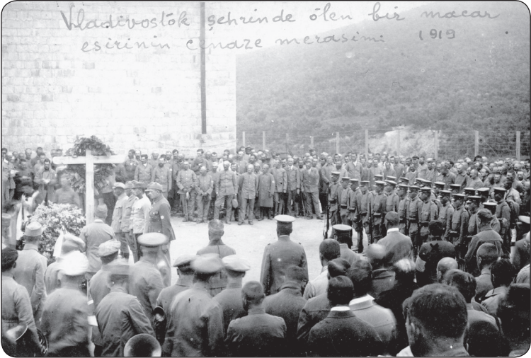
Görsel 10. Vladivostok şehrinde ölen bir Macar esirin cenaze merasimi (1919).