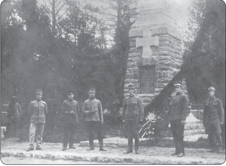
Görsel 9. İrkutsk Mezarlığı; Üseraya mahsustur.