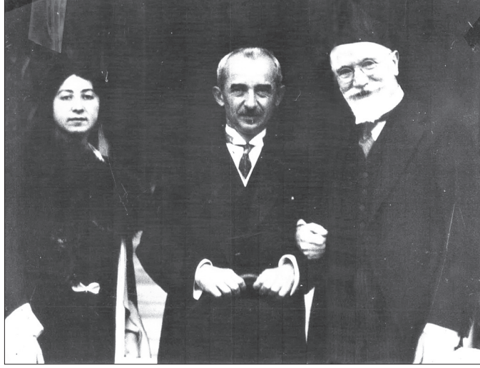
Mevhibe-İsmet İnönü ve Eleftherios Venizelos

Ve balkon kapısının üstünde beni her zaman düşündüren bir fotoğraf var. Üç kişi: Mevhibe Hanım, İsmet Paşa ve Venizelos, Yunanistan Başbakanı.