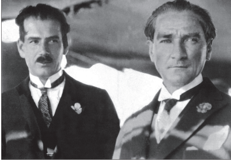
Ruşen Eşref Üneydin ve Mustafa Kemal Atatürk