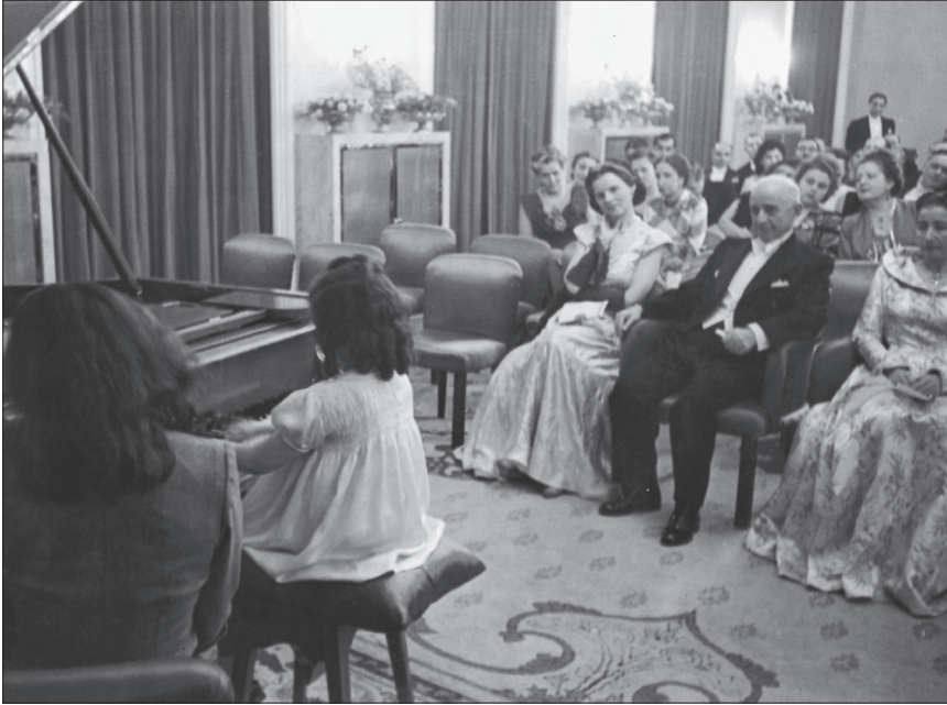
Mevhibe Hanım ve İsmet İnönü, Harika Çocuk İdil Biret'i dinlerken